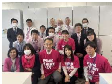
横浜市教育委員会事務局