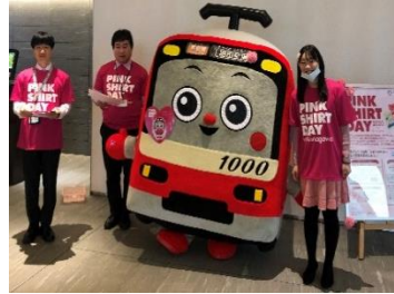
京浜急行電鉄けいきゅん